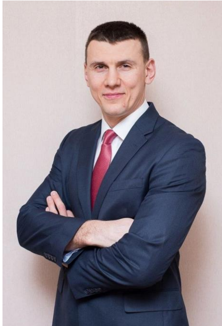
Дмитрий Савельев, чемпион мира, двукратный чемпион Европы, трехкратный чемпион России по каратэ киокусинкай

С начала реализации проекта, в 2022 и 2023 годах, прошло более 16 встреч. Среди гостей были спортсмены, писатели, режиссёры, инженеры, юристы, военные и представители администрации города.