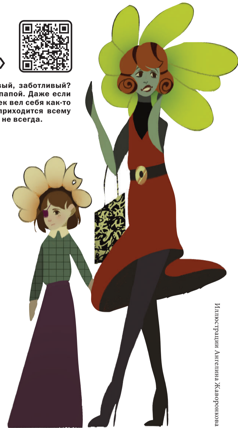
Иллюстрации Ангелина Жаворонкова

Часто случается, что ребенок родителей-нарциссов подвержен различным формам зависимости: это могут быть не только наркотики, алкоголь, но и постоянное попадание в созависимые отношения. Анна Риво отмечает, что чаще всего у нарциссичских родителей вырастает такой же нарциссичный ребенок, который выстраивает отношения с людьми по такой же модели поведения: нарциссичской.