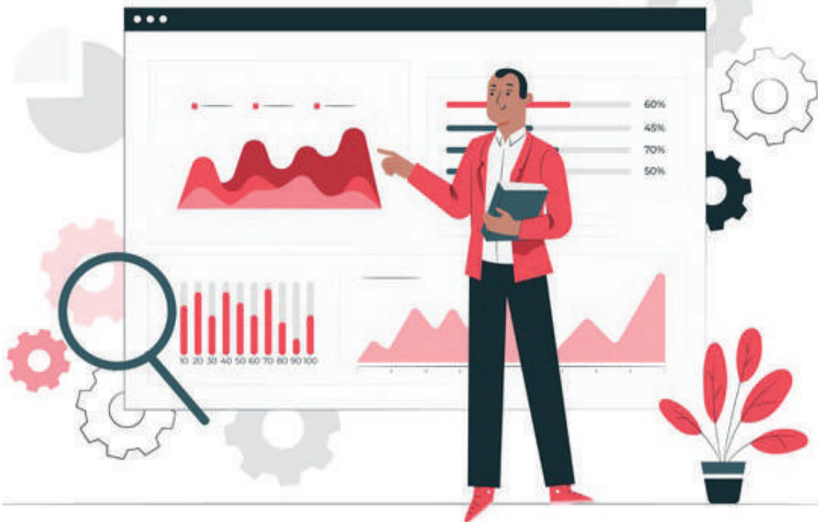
Иллюстрации Олеси Бусловой

В каждом бизнесе есть люди опытнее других, которым хочется раздать неопытного новичка. Но Дмитрий был готов к этому и знал, что так будет.