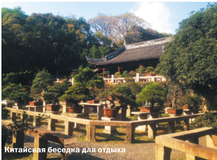
Китайская беседка для отдыха