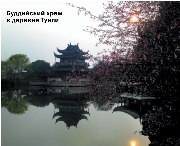
Буддийский храм в деревне Тунли