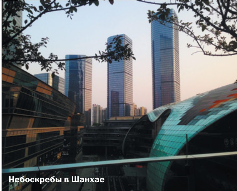
Небоскребы в Шанхае

В 95% случаев это правда, потому что для китайца покинуть свою страну – довольно большая проблема. Правительство боится, что путешественникам понравится в другой стране, и они переедут туда. Оно предпочитает, чтобы все ценные кадры и трудовые ресурсы оставались в стране, поэтому выехать из Китая нелегко. Чаще всего дают групповые визы. Китайцы любят общность, чувствуют себя некомфортно в одиночестве среди иностранцев, потому что они, по большей части, не говорят по-английски. Они предпочитают сбиться в кучу и нанять экскурсовода, который с комфортом повезёт их в любую страну. Так китайцы более уверены, что будут в безопасности. С группами обязательно ездит человек от партии, который специально следит, чтобы их не завербовали. Молодые могут путешествовать парами, хотя для этого им нужно сдать множество разных справок и дать гарантию, что они вернутся через две недели, а не останутся в другой стране.