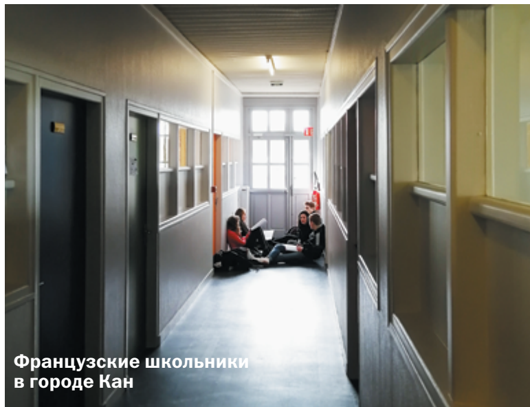
Французские школьники в городе Кан

Французское образование совершенно несопоставимо с нашим. Время занятий, количество уроков, система обучения, дисциплинарные правила – всё отличается. Если российское образование нацелено на получение максимального количества знаний во всех областях, то французы предпочитают направлять свои силы в одно русло, то есть выбирают специализацию и приобретают узкие знания. Может быть, это и правильно, раз Франция входит в топ стран с лучшим образованием. В любом случае, главное – не где ты учишься, а как.