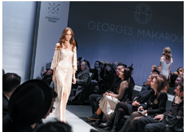
Санкт-Петербург, октябрь 2018. Показ Georges Makaroun Makaroun

– Тоже безумно смешная история. Я никогда бы не могла подумать, что мной заинтересуются Armani. Агентство мне прислало приглашение на кастинг за день до него самого, я даже не смотрела, для какого бренда мы будем работать. Просто пошла. Поняла только, что он будет проходить на Петроградской и мне сложно туда ехать: вбила адрес в карту, поняла, что это бутик Armani. Начала очень сильно волноваться. Кастинг проходил в несколько этапов. В первый день я услышала от русских организаторов: «Ждите ответа завтра», но окончательное решение все равно приняло руководство в Италии, они меня и утвердили! В показе коллекции всего принимало участие четверо девушек и четверо парней, мы выходили парами – это была основная концепция показа. Приятно, что моё участие в шоу согласовала именно итальянская сторона, возможно, в будущем будут шансы уже поработать с Armani на родине бренда.