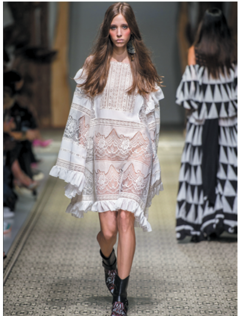
«Приятно было, что первый кастинг в Милане у меня все-таки закончился положительно» Неделя моды, Италия, октябрь 2018. Показ Mario Dice