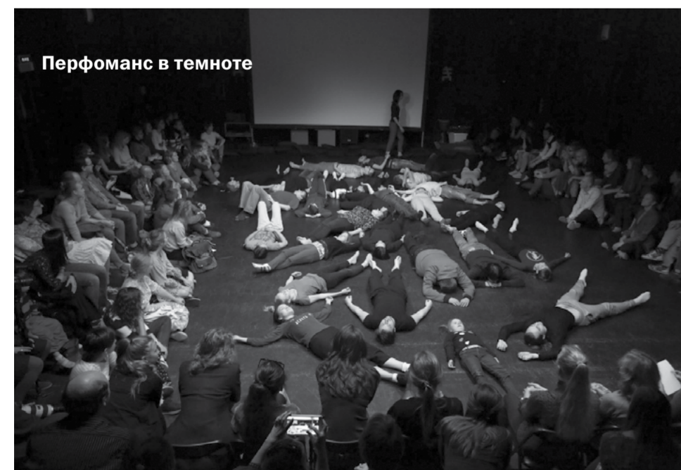
Перформанс в темноте