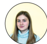
Полосу подготовила: Валерия Рыбакина

Например, один из студентов в самый неожиданный момент сказал: «Что-то как-то скучно, давайте уже петь». И ничего не поделаешь, ведь правду говорит, и все его поддержали. Кто-то переставал делать задание, потому что устал, кто-то решил, что он не в настроении и просто будет молчать. Всё происходило очень честно, без фальши, ведь эти люди элементарно не умеют притворяться, каждое их слово или действие – это картина их собственного мира, их внутреннего «я», которое мы настойчиво стараемся скрыть.