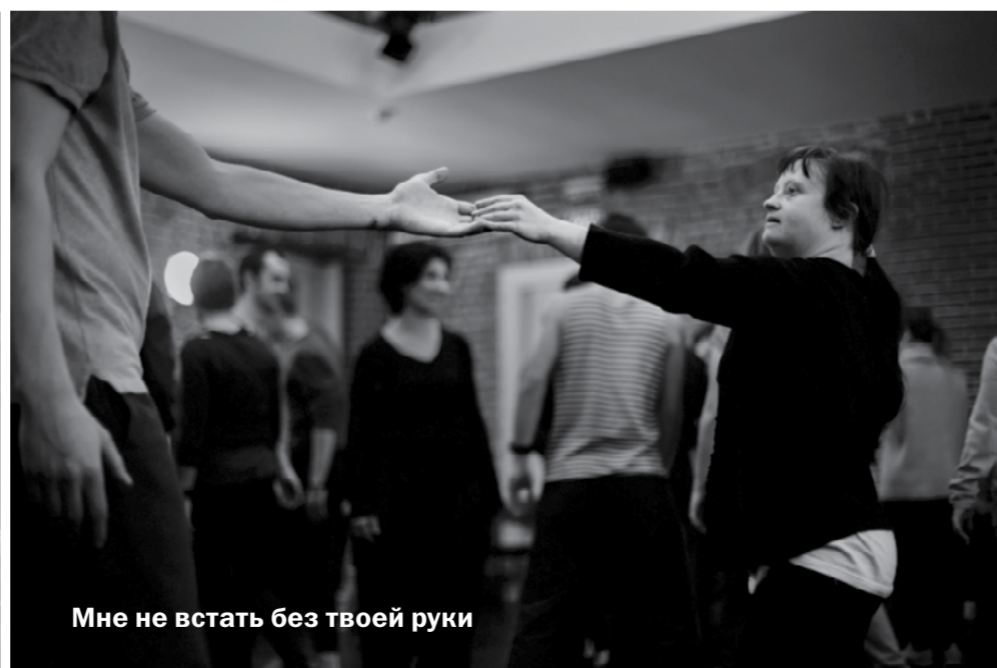
Мне не встать без твоей руки