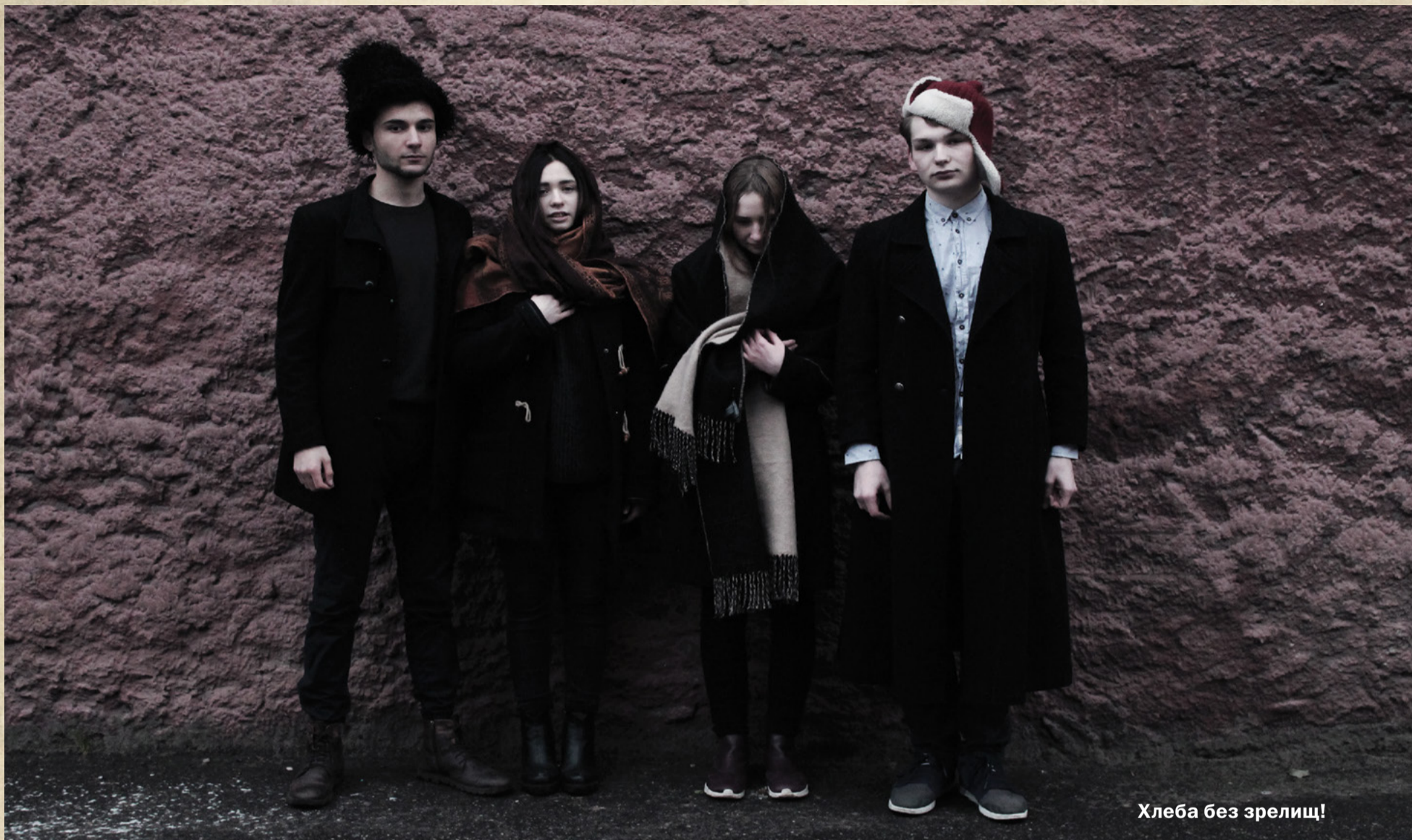
Хлеба без зрелищ!