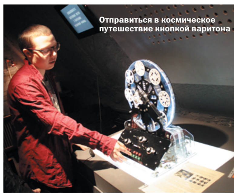
Отправиться в космическое путешествие кнопкой варитона

Стильное тёмное помещение с картинами в духе абстракционизма, изображающих, конечно же, звук, и постоянно суетящийся вокруг музыкальных творений» экскурсовод – всё это является неким пятым элементом экспозиции.