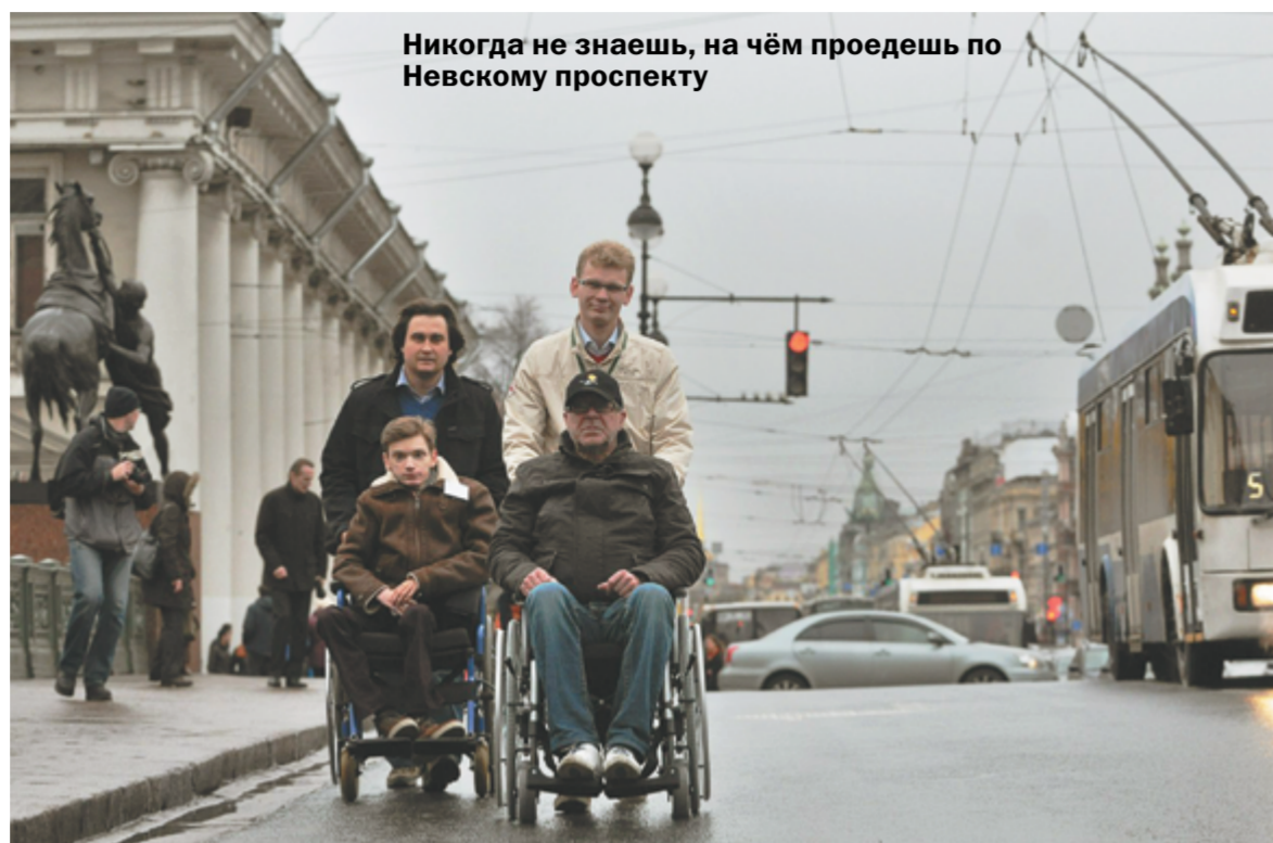
Никогда не знаешь, на чём проедешь по Невскому проспекту