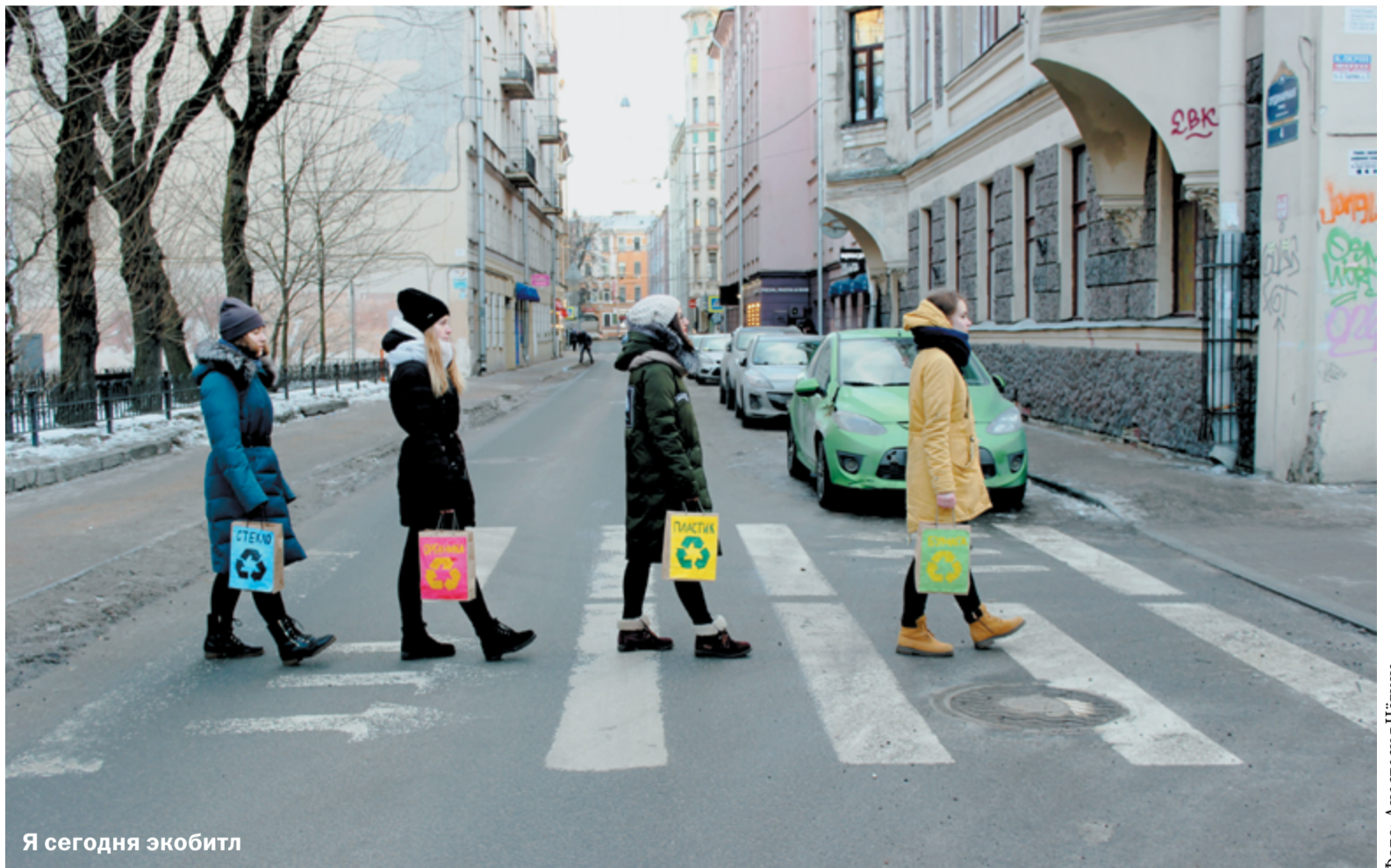
Я сегодня экомбилл

Экран ноутбука внезапно потухает, но через секунду снова загорается. Беспорядочно нажимаю клавиши. Попытки перезагрузить тщетны. Иду с компьютером под мышкой в ремонтный сервис, в котором угрюмый парень с бородой сообщает: «Купи новый, этот сдох». Покупаю новенький девайс, а старый отправляется на верхнюю полку шкафа. Знакомая ситуация? В России отработавший свой срок холодильник выставляют у парадной (вдруг кому пригодится). Старый телек ожидает поездка в райское место – на дачу, где обречён тосковать девять месяцев в году. И почему-то редко кто вспоминает про утилизацию. В проведённом нашей редакцией опросе 40 из 65 респондентов сказали, что никогда в жизни не относили старую технику для вторичной переработки. Ещё 22 петербуржца один-два