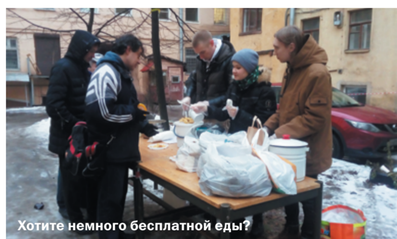
Хотите немного бесплатной еды?