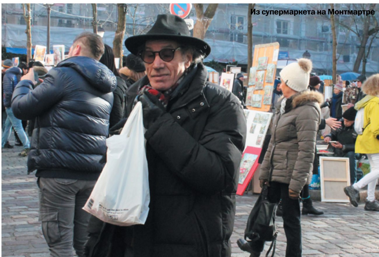
Из супермаркета на Монмартре