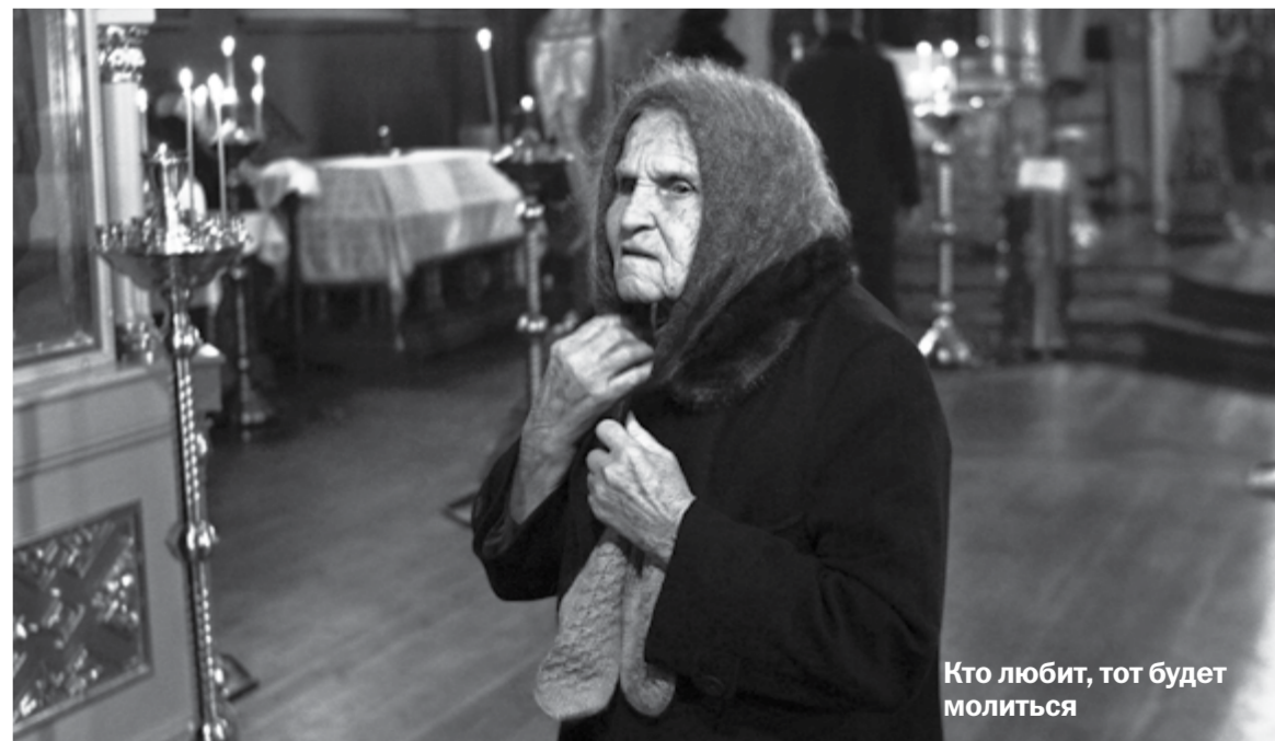
Кто любит, тот будет молиться