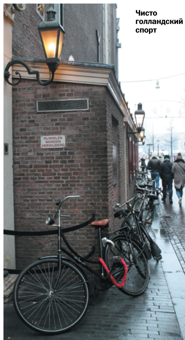
Чисто голландский спорт