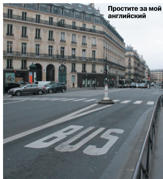
Простите за мой английский