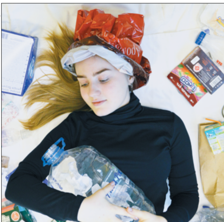
Мадонна с бутылкой

22 ноября на итоговом «Форуме действий» Общероссийского народного фронта президент Владимир Путин заявил, что в России одной из главных проблем является утилизация отходов. Действительно, на территории страны расположились огромные свалки, превышающие своей площадью Москву и другие мегаполисы вместе взятые, не обращать внимание на которые просто невозможно.