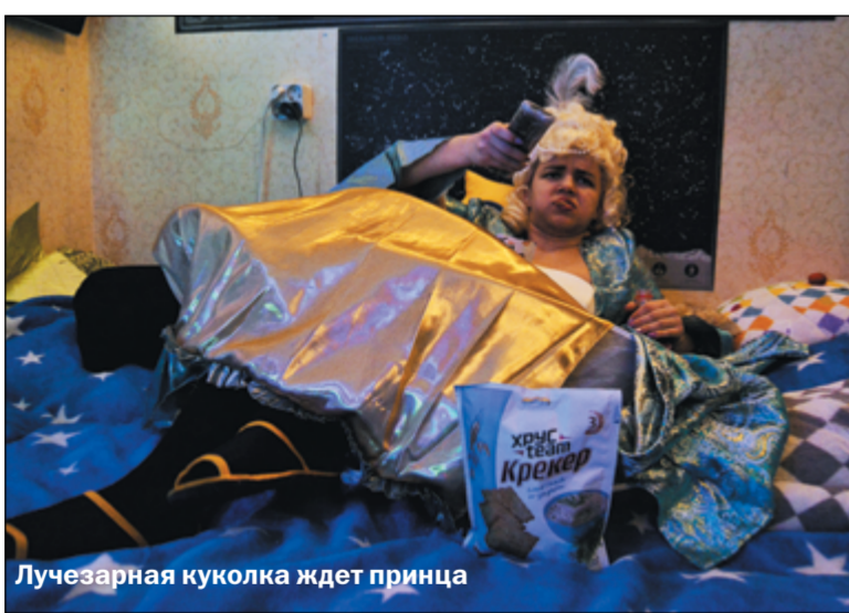
Лучезарная куклолка ждет принца

Всем знакомое обращение «Леди и джентльмены!» подразумевает наличие ещё одного игрока. Так называемая «леди», а точнее её образ, часто забывается или не рассматривается в должной мере. Итак, кто же она?