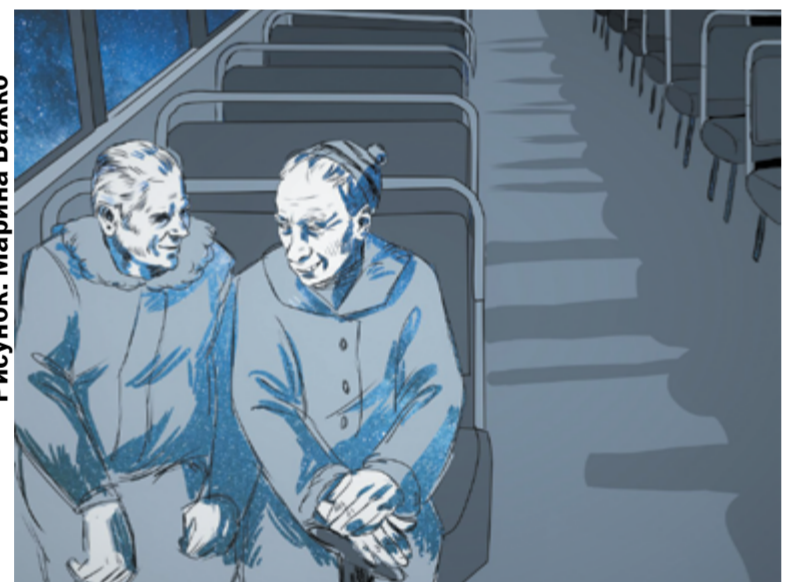
Рисунок: Марина Бажко

Школьные, студенческие годы, взростая жизнь, старость... И всё это время с тобой рядом твой преданный друг или подруга. Не о такой ли дружбе мечтает большинство из нас? Но так ли легко сохранить преданность сквозь годы? Как со временем не потеряться в проблемах, не отдалиться друг от друга, и существует ли настоящая дружба от общего букваря на парте до цветочка у последнего пристанища? Несомненно, существует.