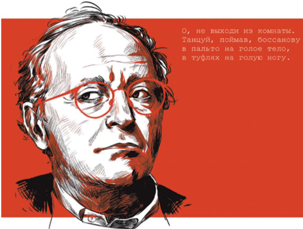
Рисунок: Марина Бажко

О, не выходи из комнаты. Танцуй, поймав, Боссанову в пальто на голое тело, в туфлях на голую ногу.