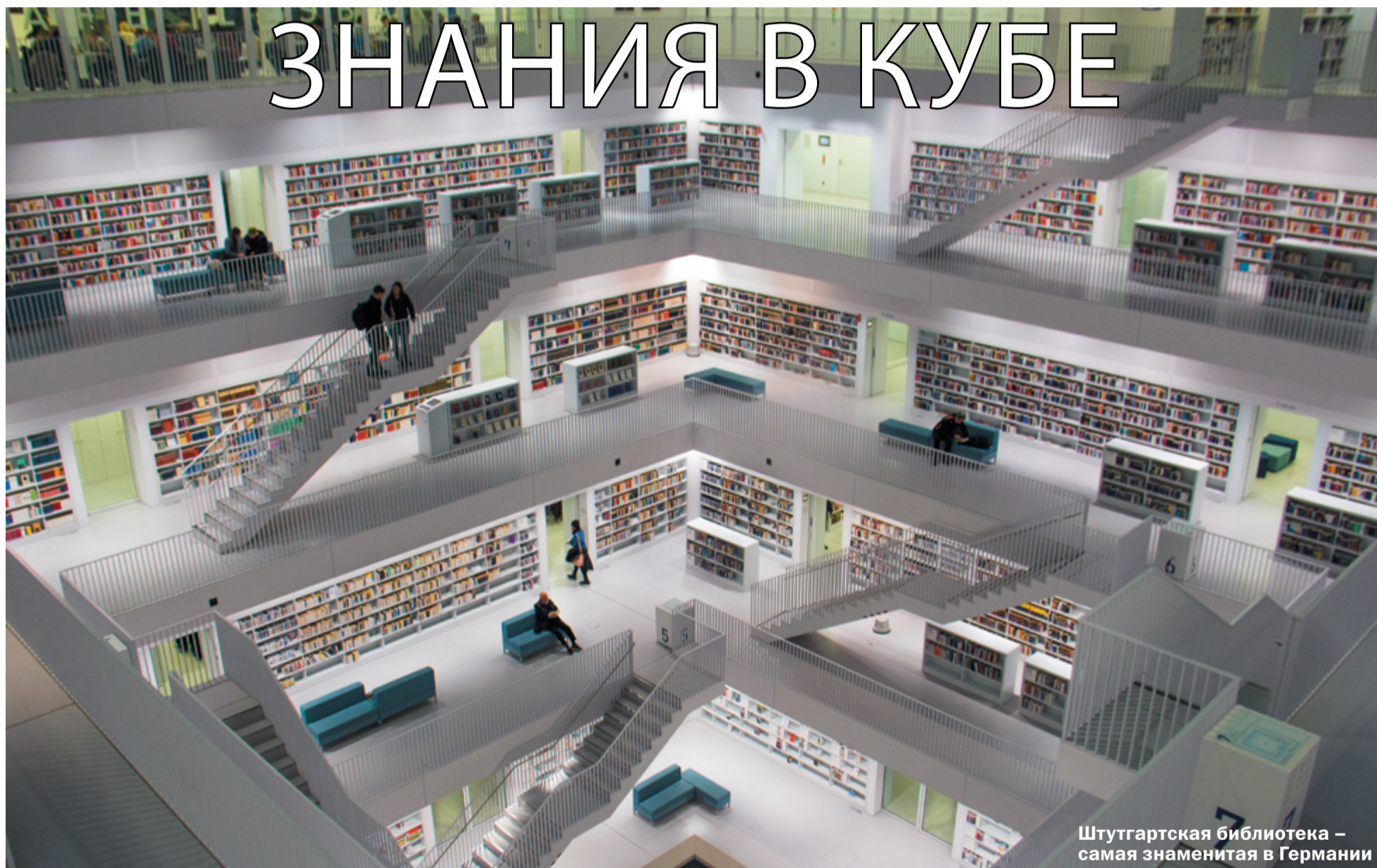
Штутгартская библиотека – самая знаменитая в Германии