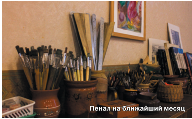
Пенал на ближайший месяц

Поэтому детям прививают вкус к реальной жизни, максимально раскрывая спектр человеческих возможностей – большое внимание