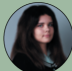
Подготовила: Анастасия Мишенева

Не каждый родитель, воспитанный на насильственном принуждении к обучению, готов понять подобную нестандартную для него методику. Но даже тем, кто именно этого и ищет, рекомендуется загодя поговорить с учителями и директором. Мамы, папы или бабушки приносят рисунки своей крохи, вкратце описывают, почему вальдорфская педагогика им близка, и разъясняют, чего они ждут от ребенка. Это важно, потому что взгляды школы и семьи на воспитание при таких либеральных методах просто не могут не совпадать, иначе – во всем этом нет никакого толка. Родители, которые еще с ранних лет их чада осознают, каким хотят его видеть, говорят, вальдорфские детские сады сравнимы с раем, особенно, если повезет с воспитательницей.