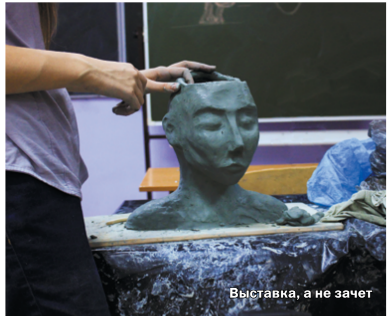
Выставка, а не зачет