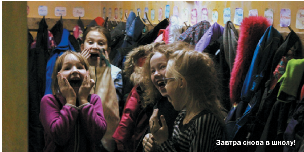
Завтра снова в школу!

Читателю наверняка уже стало понятно, что вальдорфская школа изрядно отличается от среднестатистической как методами, так и формами преподавания. Например, в первом классе детей не торопят