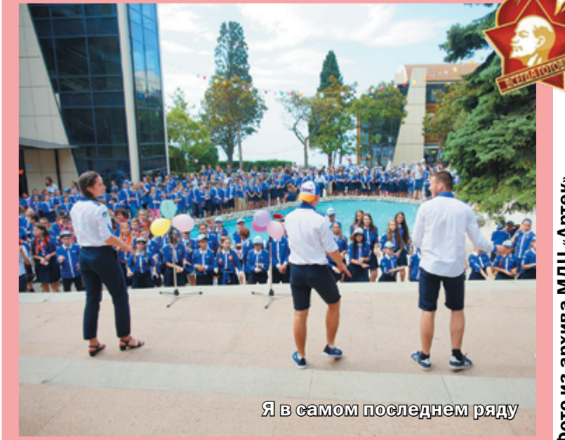
Я в самом последнем ряду

Это ведь общее дело: один за всех, и все за одного. Один не танцует, и все на одного. Одним в «Артеке» быть почти невозможно: если и удастся как-то выделиться, тебя тут же сносит волна одинаковой для всех формы, одинаковые для всех движения, одинаково-