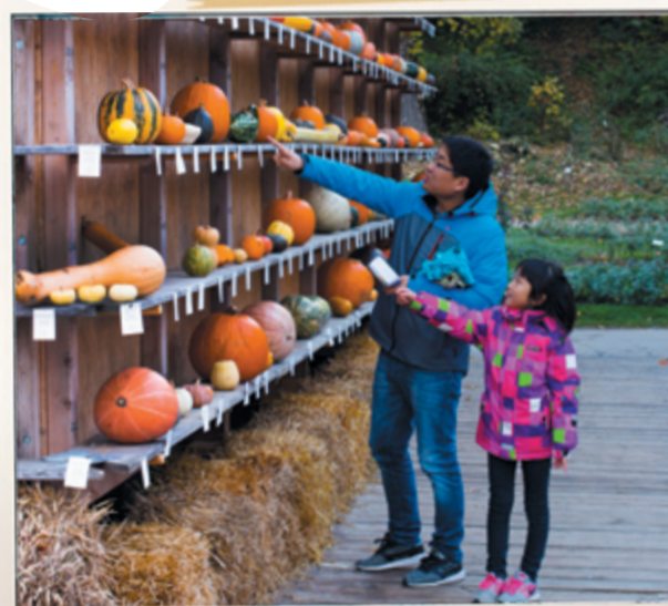
Какую «карету» выбрать?

«Вы меня, наверное, не знаете», – начал молодой человек, пришедший в Гейдельбергский университет в середине XIX века, – но скоро я прославлюсь и стану знаменитым американским писателем!» Умеют же некоторые создать первое впечатление. Дело в том, что этот университет знаменит не только своей богатой историей, но и потрясающими студенческими вечеринками, которые в свою очередь богаты на невероятные байки. Именно на такую вечеринку и пришел молодой Марк Твен, чтобы собрать материалы для своих будущих книг. Так в Германии «родился» Том Сойер. Так и я набралась невероятных немецких историй, и в скором времени, возможно, появится новый великий писатель.