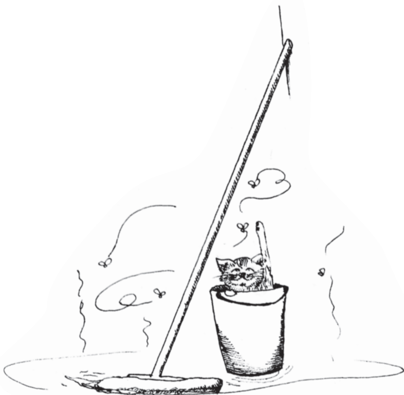
Иллюстрация Евгении Горбуновой