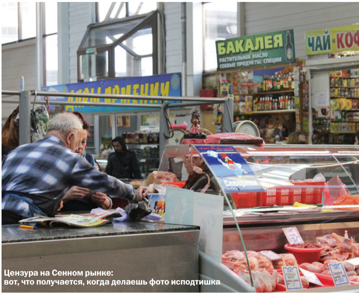
Цензура на Сенном рынке: вот, что получается, когда делаешь фото исподтишка