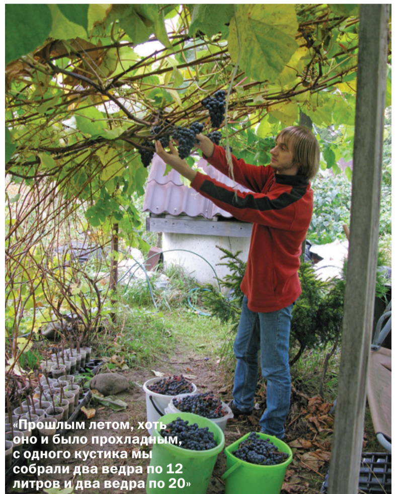
«Прошлым летом, хоть оно и было прохладным, с одного куста мы собрали два ведра по 12 литров и два ведра по 20»

Действительно, земельный вопрос в сельском хозяйстве стоит достаточно остро. Земли на всех не хватает, а брать её в аренду выливается в совершенно баснословные деньги. К тому же, если осваивать большие площади, то без техники тоже не обойтись, а где