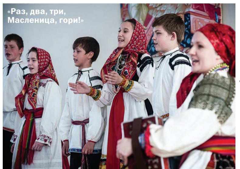
«Раз, два, три, Масленица, гори!»

При этом мы вовсе не должны изолироваться от даров западной цивилизации, ведь и она сыграла немаловажную роль в формирова-