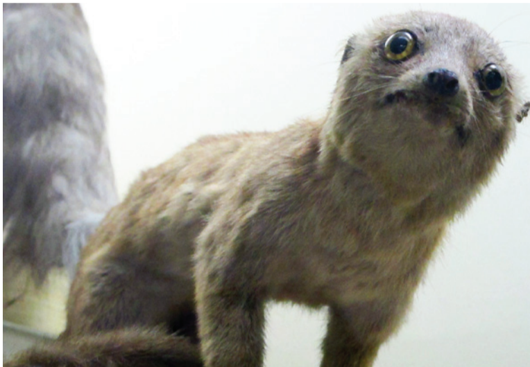
После смерти плохие лемуры попадают в зоологический музей

1 Планетарий «Убогая выставка с громким названием» – именно такой комментарий оставляет мама трёх детей, решившая сводить своих чад посмотреть на планеты. Крайне не лестные отзывы об этом месте оставляют посетители. Неоправданно высокая цена за «смазанные картинки из интернета» и скучный видеоряд не дают никаких положительных эмоций.