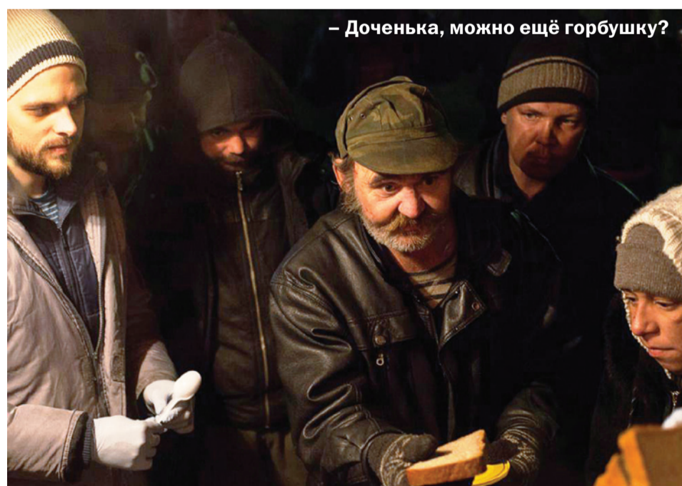
— Доченька, можно ещё горбушку?