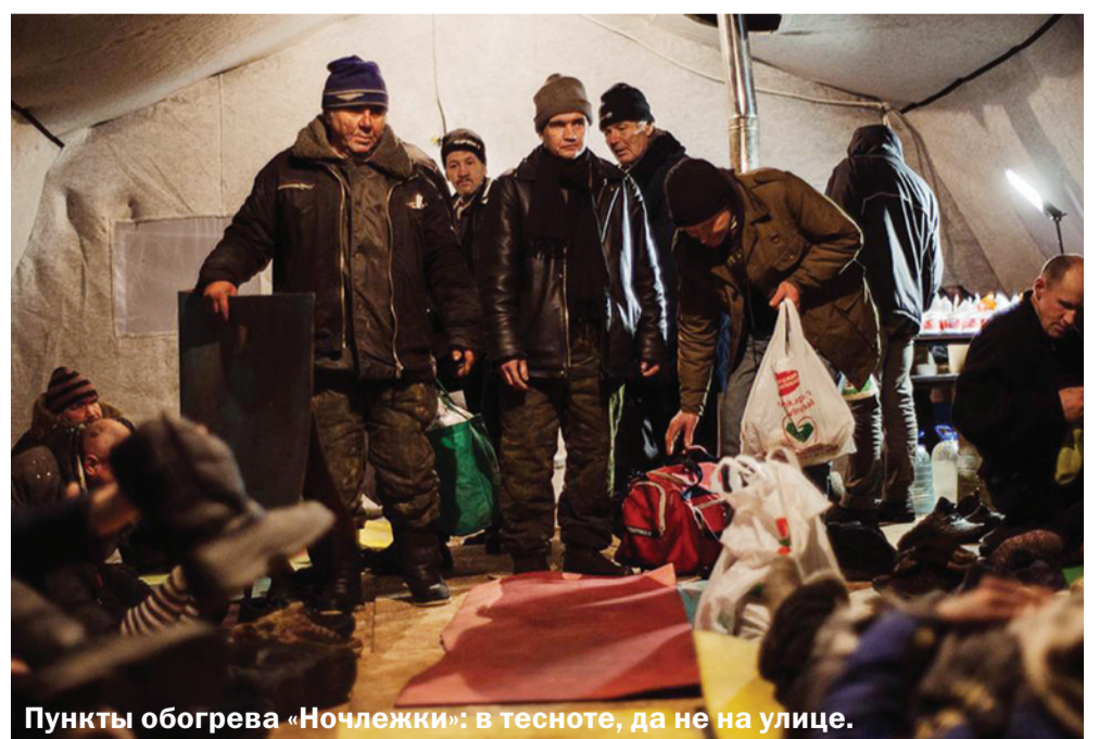
Пункты обогрева «Ночлежки»: в тесноте, да не на улице.