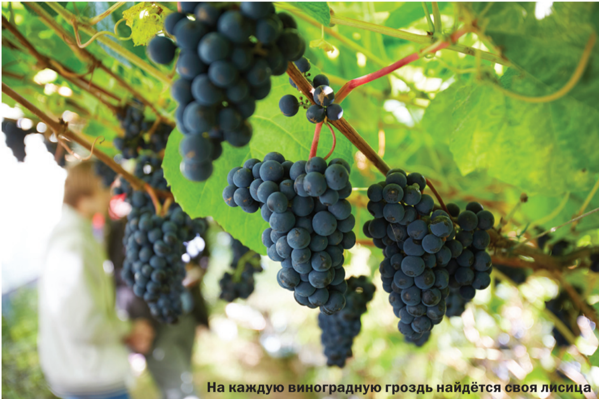
На каждую виноградную гроздь найдётся своя лисица

Невероятно, но факт: в Петербурге виноград спел на неделю раньше, чем в Москве, хоть там гораздо теплее. А воронежские селекционеры выяснили, что за счёт белых петербургских ночей у нас ягоды вызревают даже на 45 дней раньше, чем на Кавказе!