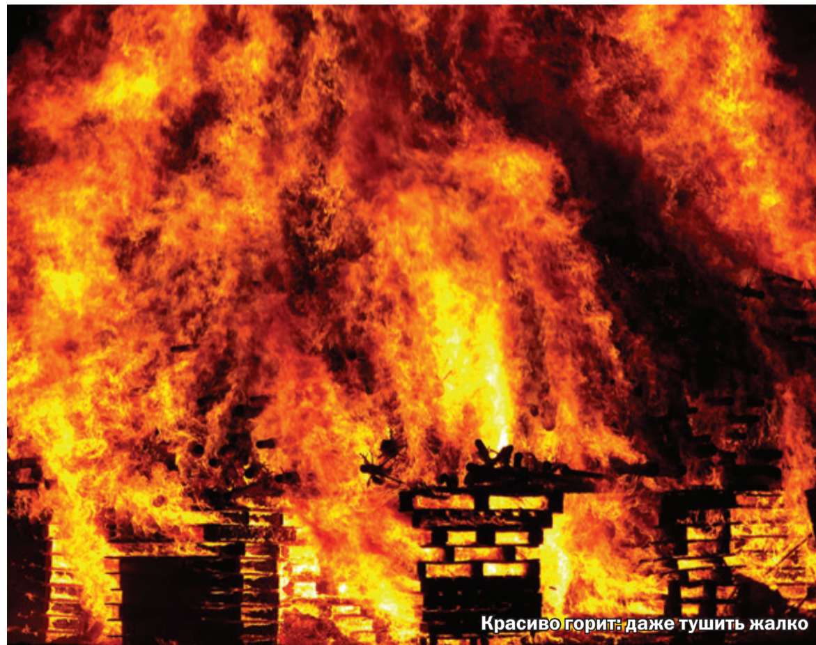
Красиво горит: даже тушить жалко

– Несколько лет назад начальник караула у нас отличился. Он сейчас не работает, к сожалению. Горела квартира на шестом этаже. С балкона семья просила о помощи. Было трудно подъехать из-за припаркованных машин, и начальник караула отдал приказ тому звену про-