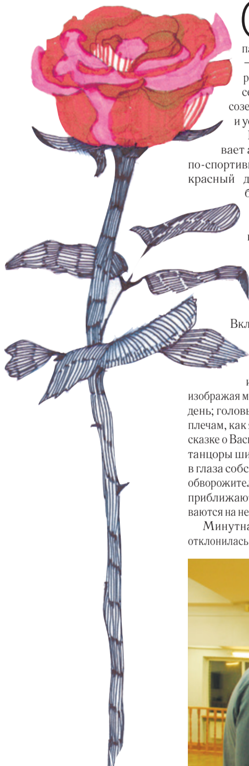
Иллюстрация: Юлия Коба