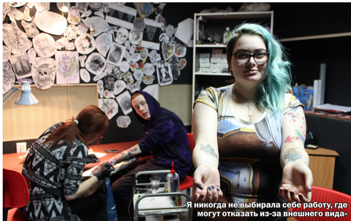
«Я никогда не выбирала себе работу, где могут отказать из-за внешнего вида»

— Стараюсь быть человеком. И мнение людей вокруг постепенно, с едва заметной скоростью, но будет меняться. Конечно, это — капля в море, но будь этих капель больше, может, уже совсем скоро ситуация обретет иные повороты.