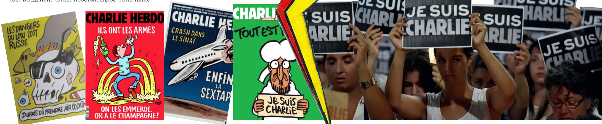
Рисунок: Александра Лимарева