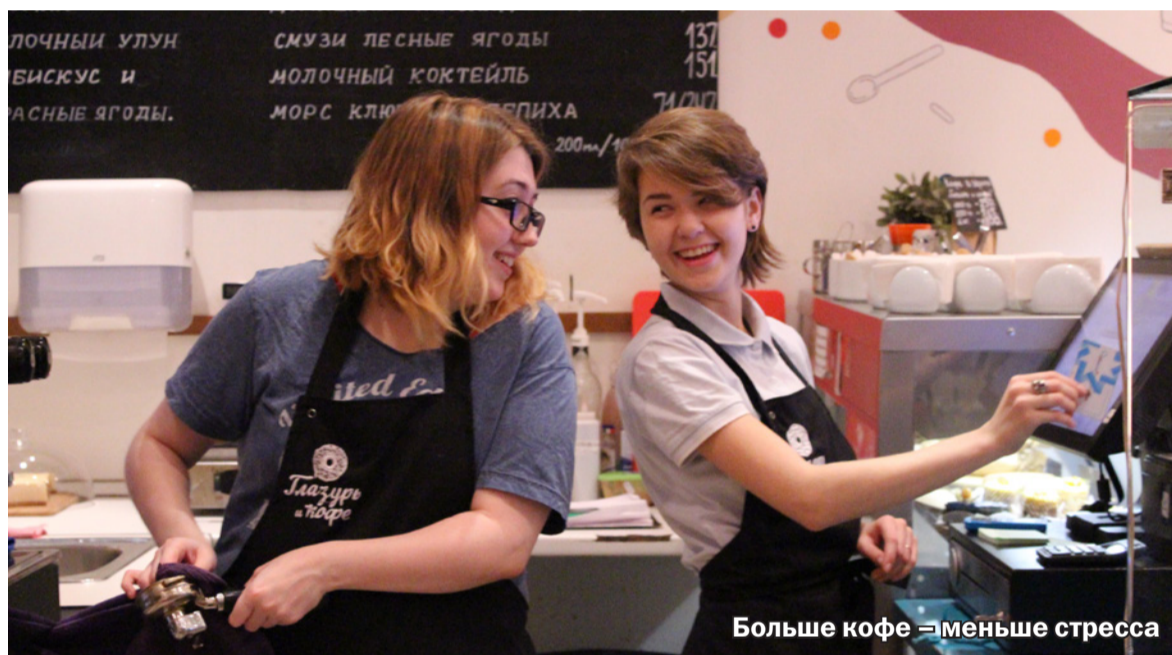
Больше кофе — меньше стресса

Мне гордо вручили корзину, доверху наполненную грязной посудой, которую предстояло вымыть. Ладно, посуда — это еще полбеды. На каждой тарелке — салфетки, намертво приклеенные бальзамическим соусом, шоколадом, глазурью и медом. Миф об «аккуратном посетителе» был тут же развеян. Справилась с различными кружками, чашками, ложками и прочей утварью — теперь еще нужно все это чудо впахнуть в посудомоечную машину. Кашу я в детстве не любила, так что сил было мало. Чуть не упав, с усилием поднимаю посуду и громко хлопаю дверцей гаджета, чтоб наверняка.