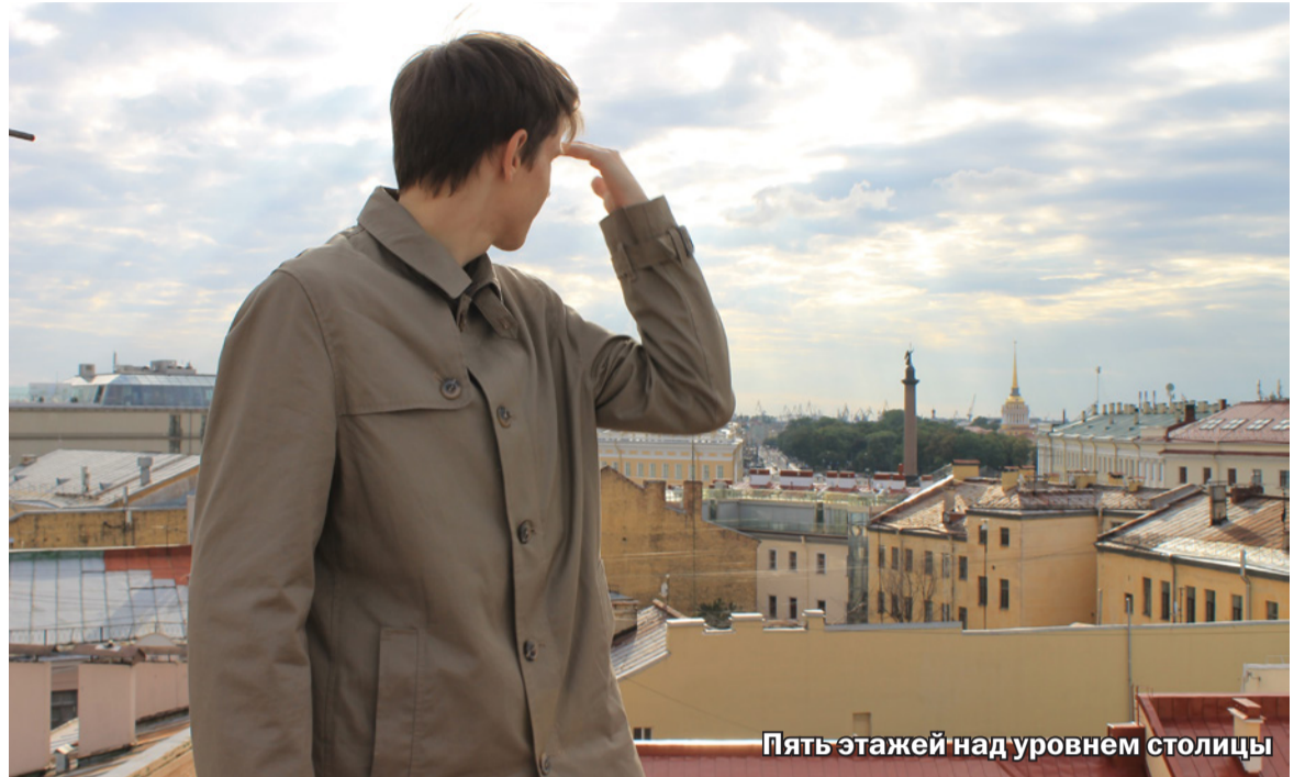
Пять этажей над уровнем столицы

Но все обошлось профилактической беседой. Как такового наказания за прогулки по крышам, если это не частное охраняемое предприятие или не адми-