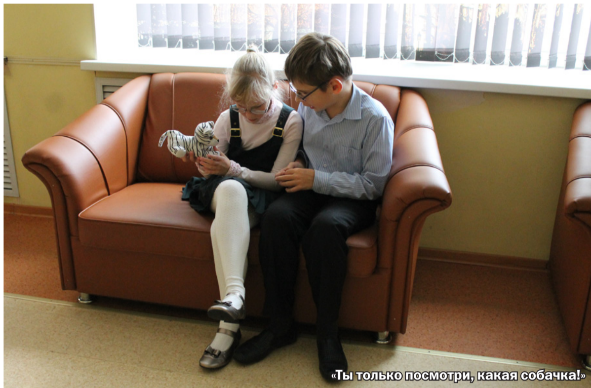
«Ты только посмотри, какая собачка!»

Большие окна и яркие стены, которые украшены детскими поделками и рисунками. На первый взгляд, обычная школа, только вот дети здесь учатся особенные. Об этом напоминает аналог лежащих полицейских на полу – выпуклые полосы, по которым ребята ориентируются в пространстве. А также непривычно громкие звонки: вместо «дзызынь», успевшего надоесть почти каждому ученику массовой школы, здесь звучат произведения классиков.