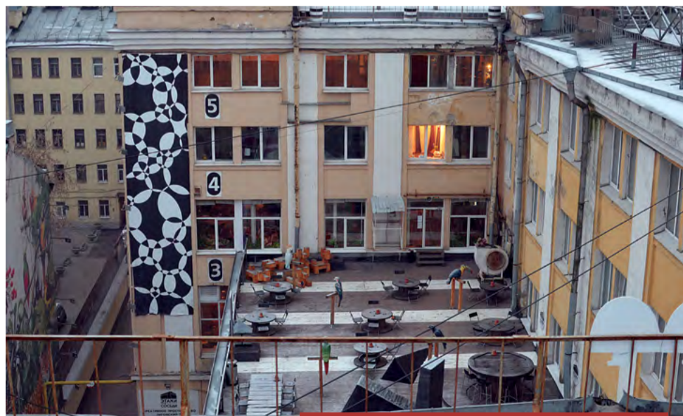
29 линия Васильевского острова, 2

Или просто «Этажи», как их называют большинство людей, хоть что-то знающих про это место. Когда-то здесь, в стенах советского хлебозавода, пекли вкусный хлеб, а теперь это одно из самых «молодежных» мест города. 5 этажей современного искусства, 5 этажей на которых организуются выставки, фестивали и праздники. А во дворе Этажей – обмены ненужными вещами, благотворительные мероприятия. Я слышала много разных мнений об этом месте. Моя знакомая говорит, что её оно угнетает, ей не нравятся дизайнерские решения по оформлению залов, не нравится большинство представленных здесь работ и гнетет атмосфера. Но, как известно, «на вкус и цвет...».