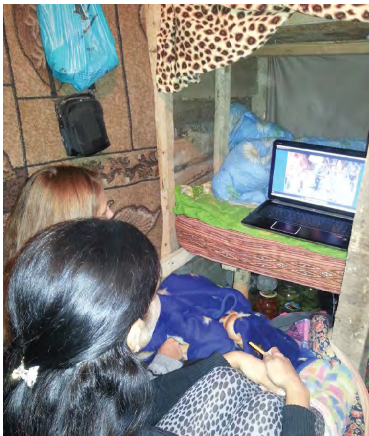
Подвал, в котором жили наши родственники, прячась от бомбежек