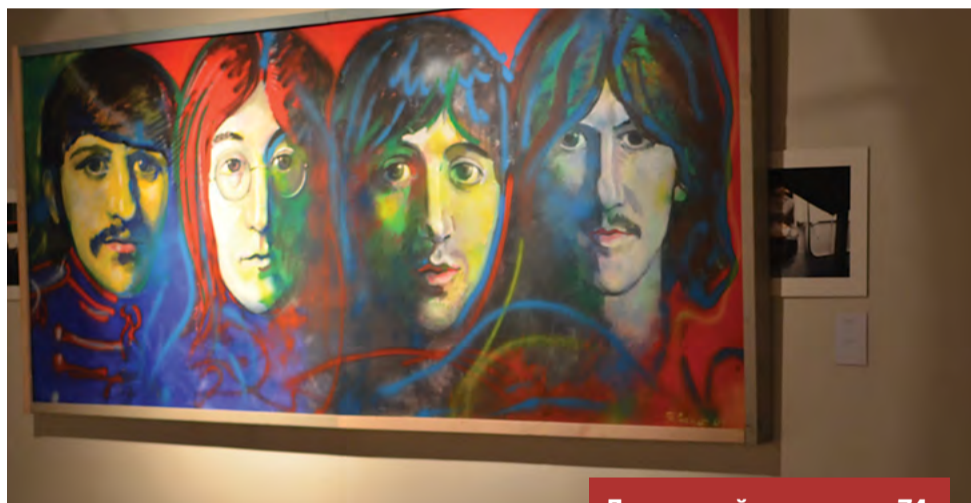
Лиговский проспект, 74

Музей современного искусства «Эрарта» немного выделяется среди трех остальных мест, так как больше похоже на типичные петербургские музеи с немного другим «наполнением», чем креативное пространство. Тем не менее, здание, расположенное на Васильевском острове, привлекает немало гостей, там проводятся экскурсии, беседы, живые спектакли для школьников. Экскурсоводы через экспонаты музея раскрывают скрытую суть тех или иных «странных» на первый взгляд полотен и инсталляций, связывая тонкие образы с актуальными проблемами современности, рассказывая историю, как нашей страны, так и мира в целом. Такое современное искусство нравится далеко не всем, но оно не оставляет равнодушным. У кого-то остается очень негативный осадок от увиденного, кто-то поражен глубиной смысла, которую передал художник, его интересным замыслом или воплощением идеи.