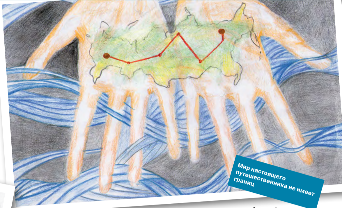
Мир настоящего путешественника не имеет границ