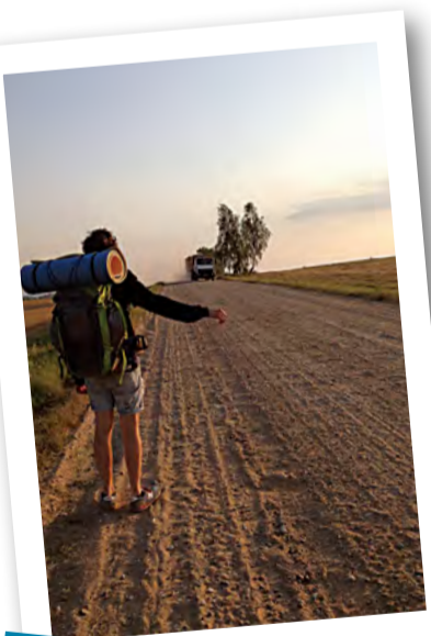
Никогда не угадаешь, кто тебя подвезёт

Иногда складывается ощущение, что есть такие отдельные дороги, водители на которых объединены в некое тайное общество негодяев. И когда идешь вдоль трассы, не только абсолютно невозможно прибегать к «стопу», а, наоборот, нужно еще следить, чтобы тебя не обдали потоком грязной воды из первой попавшейся лужи.