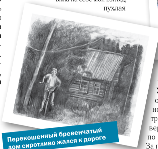
Перекошенный бревенчатый дом сиротливо жался к дороге

Из потока проезжающих мимо машин уже в течение часа не тормозила ни одна. На улице промозгло. Солнца нет. Недалеко от трассы уютилась деревенька. Прямо у обочины стоит дом с белыми ставнями, из окна которого за нами следит немолодая женщина. Как только она уловила на себе мой взгляд, пухлая