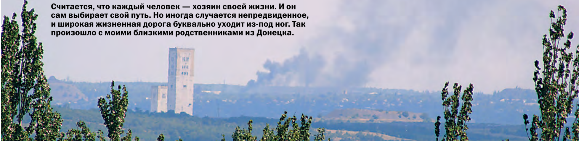
Донецк. Вид из окна квартиры моих родственников во время очередного обстрела

Считается, что каждый человек — хозяин своей жизни. И он сам выбирает свой путь. Но иногда случается непредвиденное, и широкая жизненная дорога буквально уходит из-под ног. Так произошло с моими близкими родственниками из Донецка.