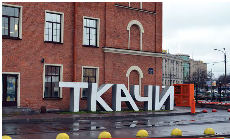
Набережная обводного канала, 60

«Ткачи», так же как и «Этажи», располагаются на территории бывшего советского предприятия – прядильно-ткацкой фабрики им. Петра Анисимова. Из всех вышеперечисленных мест это – самое молодое. Открылось оно в 2010 году, и в этот же год тут впервые состоялась Ночь музеев, которая теперь проводится там ежегодно. Хорошо отремонтированное здание из красного кирпича вытянулось вдоль набережной Обводного канала. Нижние несколько этажей, в особенности первый, сдаются в аренду разными дизайнерским, необычным магазинам, офисам. Очень часто в «Ткачах» проводятся детские и семейные мероприятия, фестивали «Краски детства», «Семейные дни» и другие.