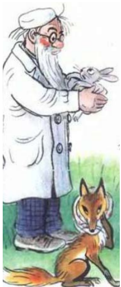
рис. В. Сугеева

Если закон примут окончательно, подросткам младше 18 лет будет запрещено появляться без сопровождения родителей