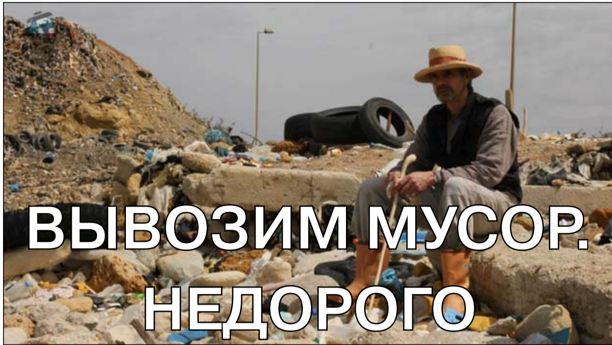
Кадр из фильма «Мусор»