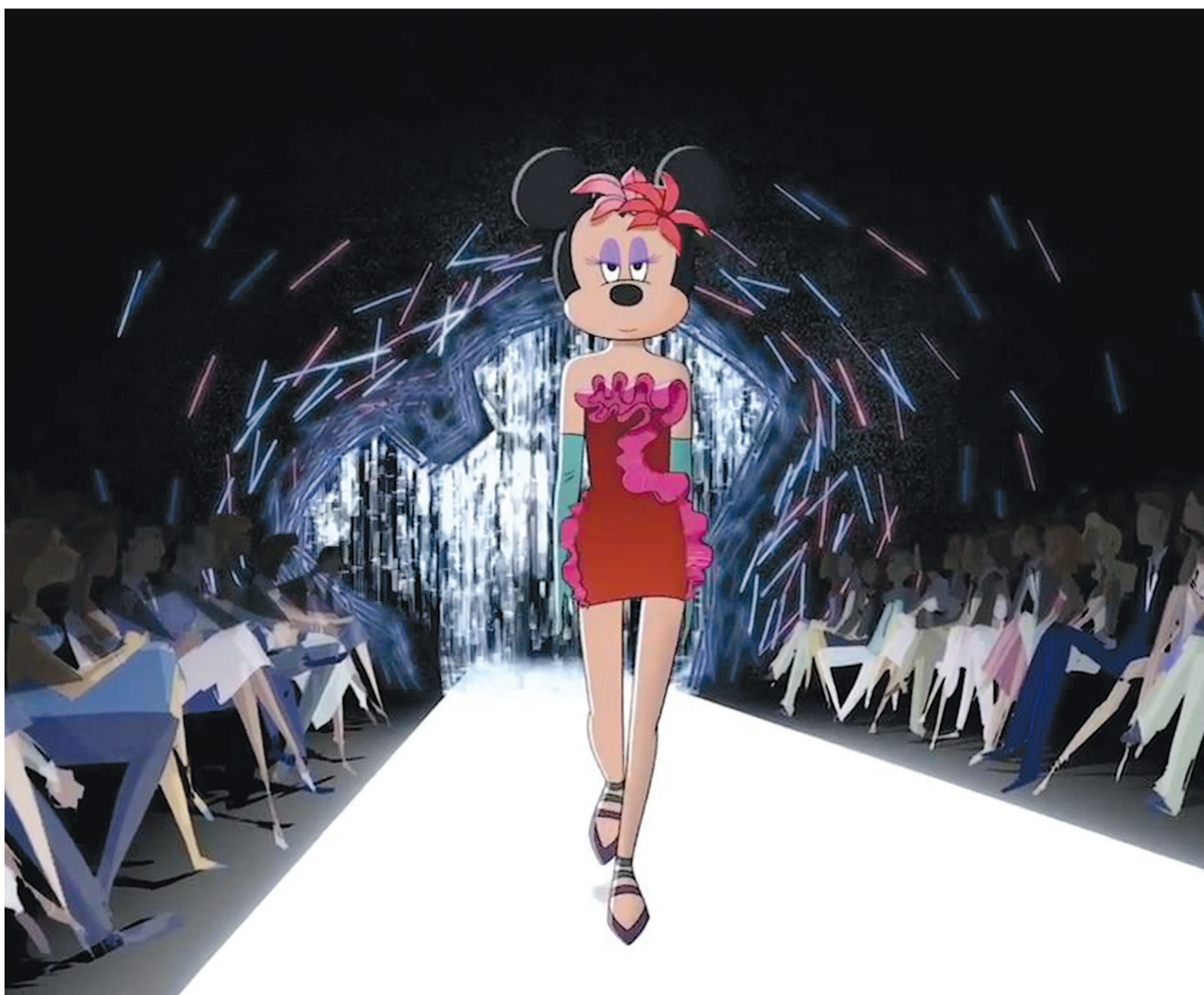
Кадр из анимационного ролика «Disney Electric Holiday»

“ На собраниях участники со- общества обсуждают новые мультфильмы и их влияние на детскую психику