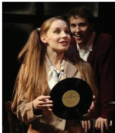
Сцены из спектакля «Возвращение в любовь»