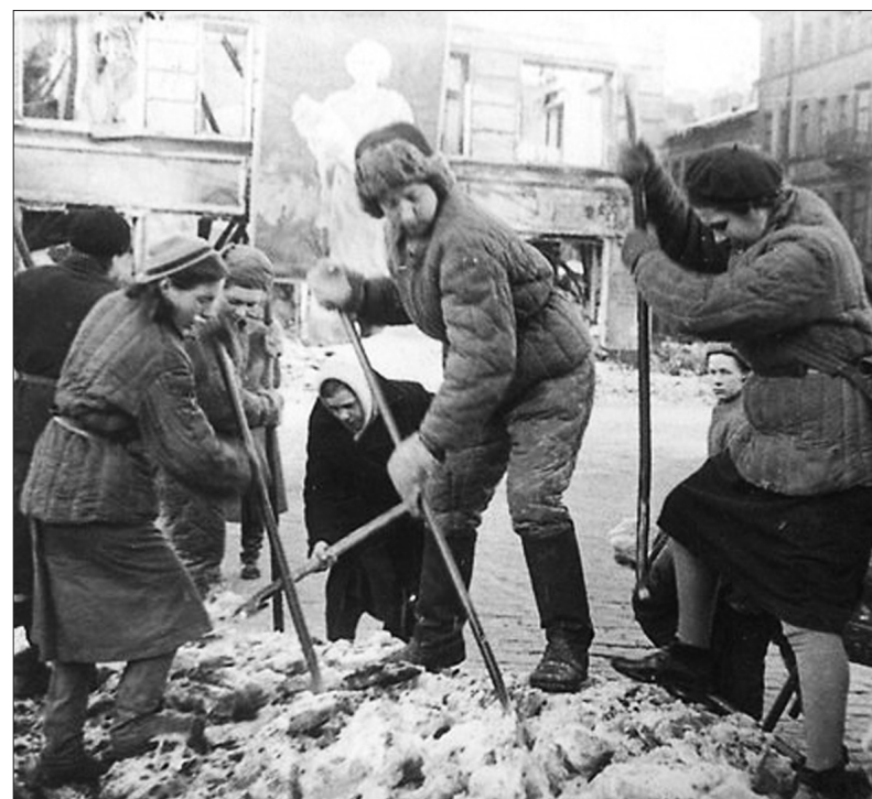
Март 1943 г. Девушки-бойцы МПВО за расчисткой Лиговского проспекта

Вода, тепло, свет. И, конечно, хлеб. В первую очередь с ним