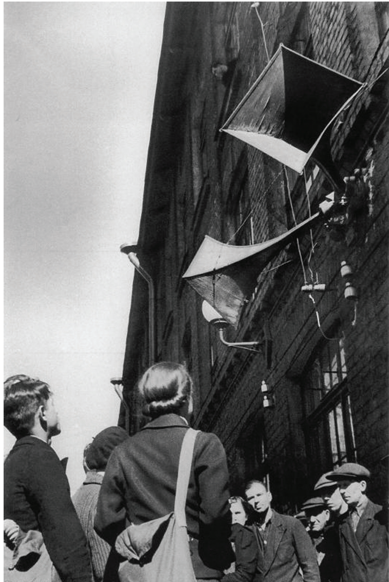
Рабочие слушают сообщение Информбюро

История моей семьи неразрывно связана с заводом ЛОМО. Такое название он получил лишь спустя 20 лет после Великой Отечественной войны. Раньше в состав оптического объединения входили заводы «Прогресс», «Кинап» и ГОМЗ.