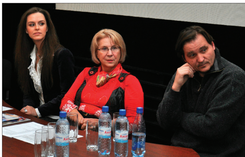
Среди участников фестиваля – актёры и режиссёры