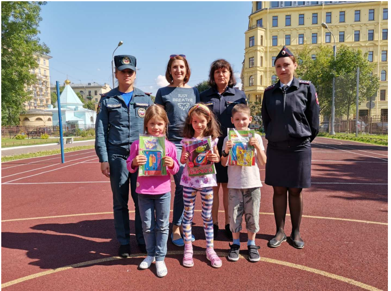
ОНДПР Центрального района 23.07.2019