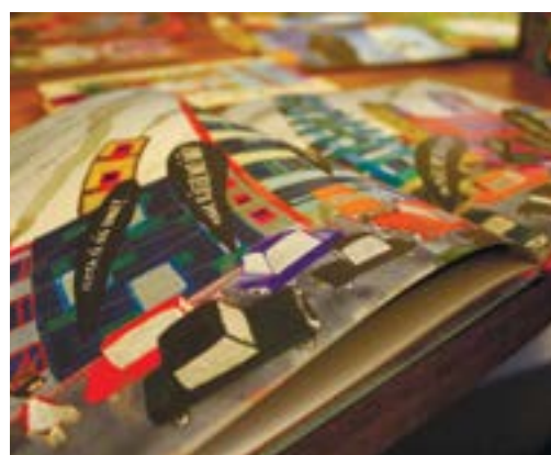
Авангард для маленьких