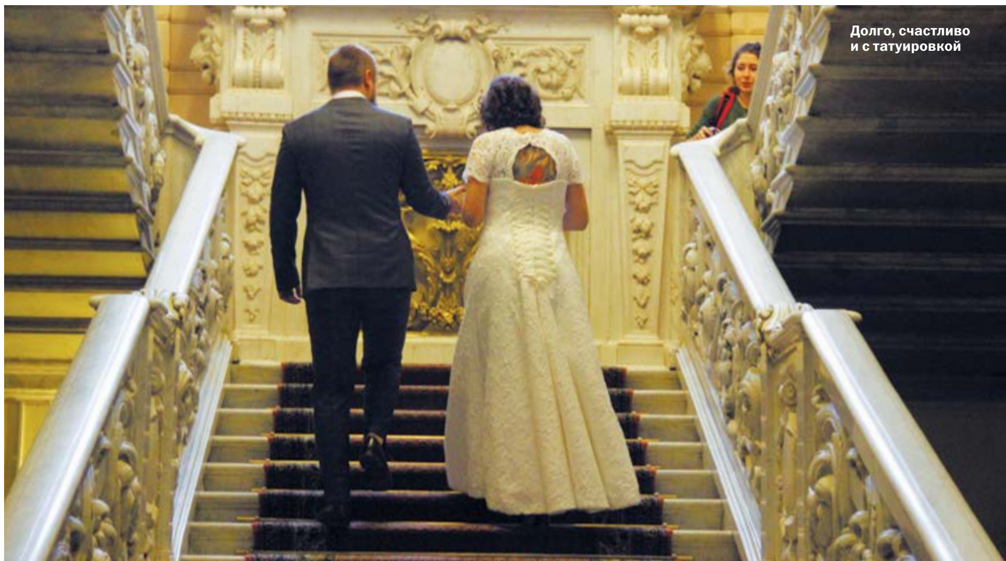
Долго, счастливо и с татуировкой