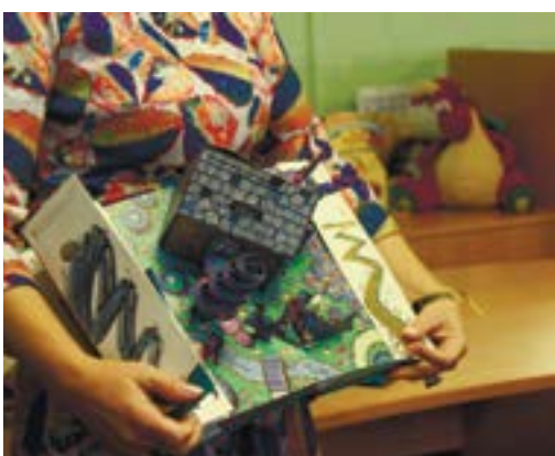
Домик Бастинды вырос из страниц